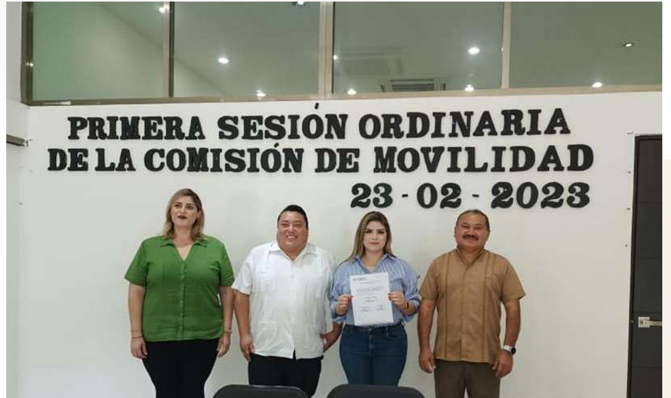
23 feb. Primera Sesión Ordinaria de Movilidad, con el objetivo principal de garantizar que el trabajo vial realizado en la Av. Zetina Gasca, cumpla con la normatividad correspondiente y sea benéfico para la comunidad.