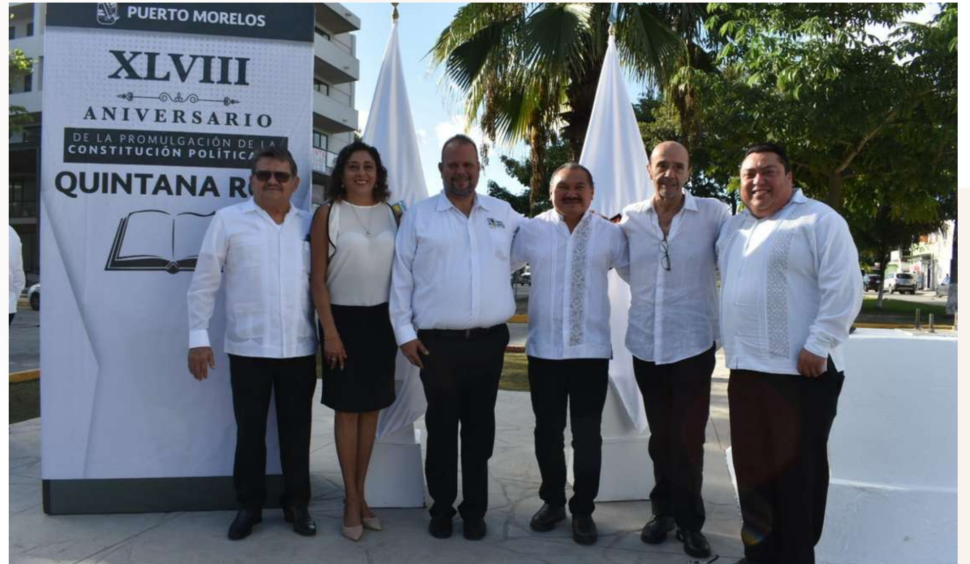
12 ene. XLVIII Aniversario de la Promulgación de la Constitución Política de Quintana Roo.