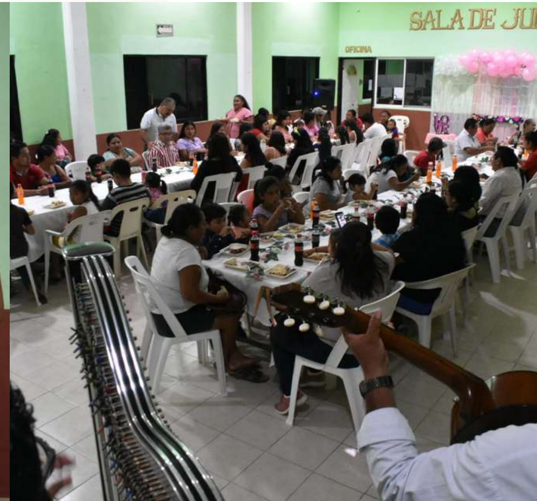
17 feb. Convivio del 14 de Febrero con madres de familia de Puerto Morelos