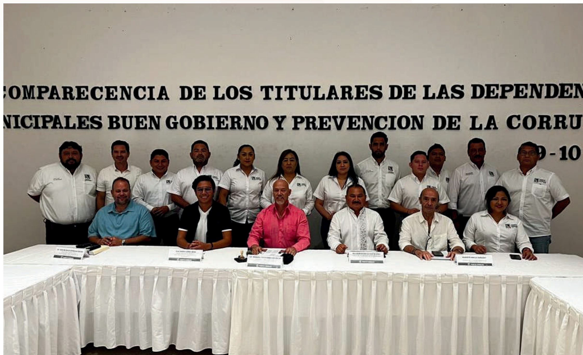
19 oct. Comparecencia de la Tesorería Municipal ante la Comisión de Anticorrupción y Participación Ciudadana.