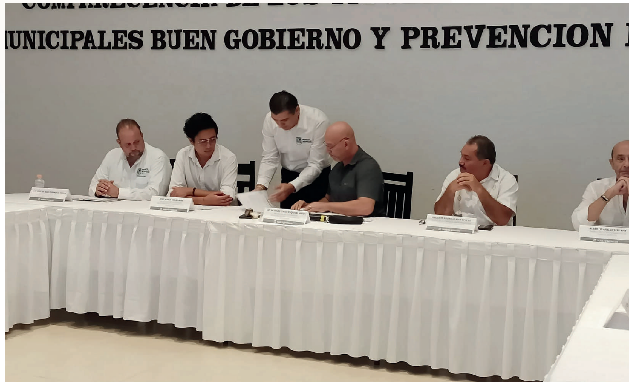
19 oct. Comparecencia de la Secretaría de Obras y Servicios Públicos y la Secretaría de Desarrollo Urbano y Ecología ante la Comisión de Anticorrupción y Participación Ciudadana.