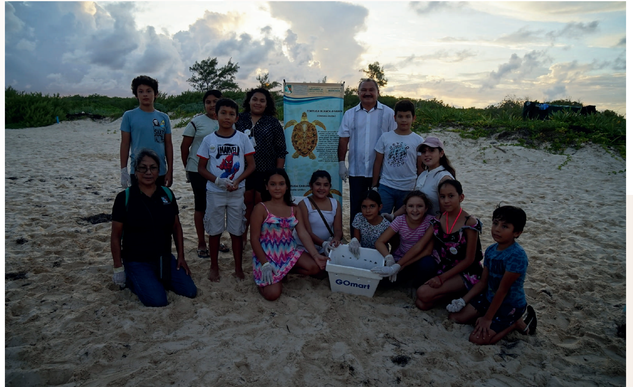
15 oct. Limpieza de Punta Brava y observación de la entrada de las tortugas al mar, con los integrantes de Cabildo Infantil 2022 .