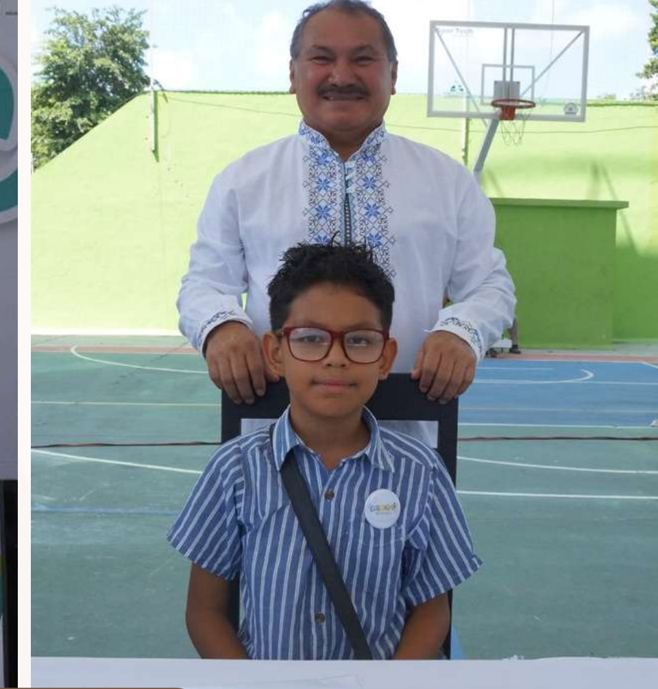
30 jun. Sesión Ordinaria de Cabildo Infantil 2023.