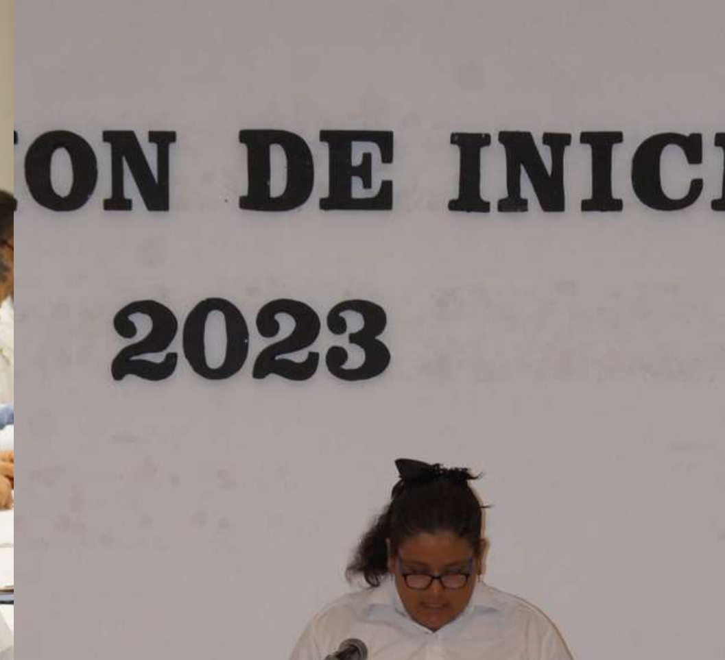
24 jun. Presentación de Iniciativas por parte de los niños y niñas de Cabildo Infantil , y selección de los 12 integrantes que lo conformarán.