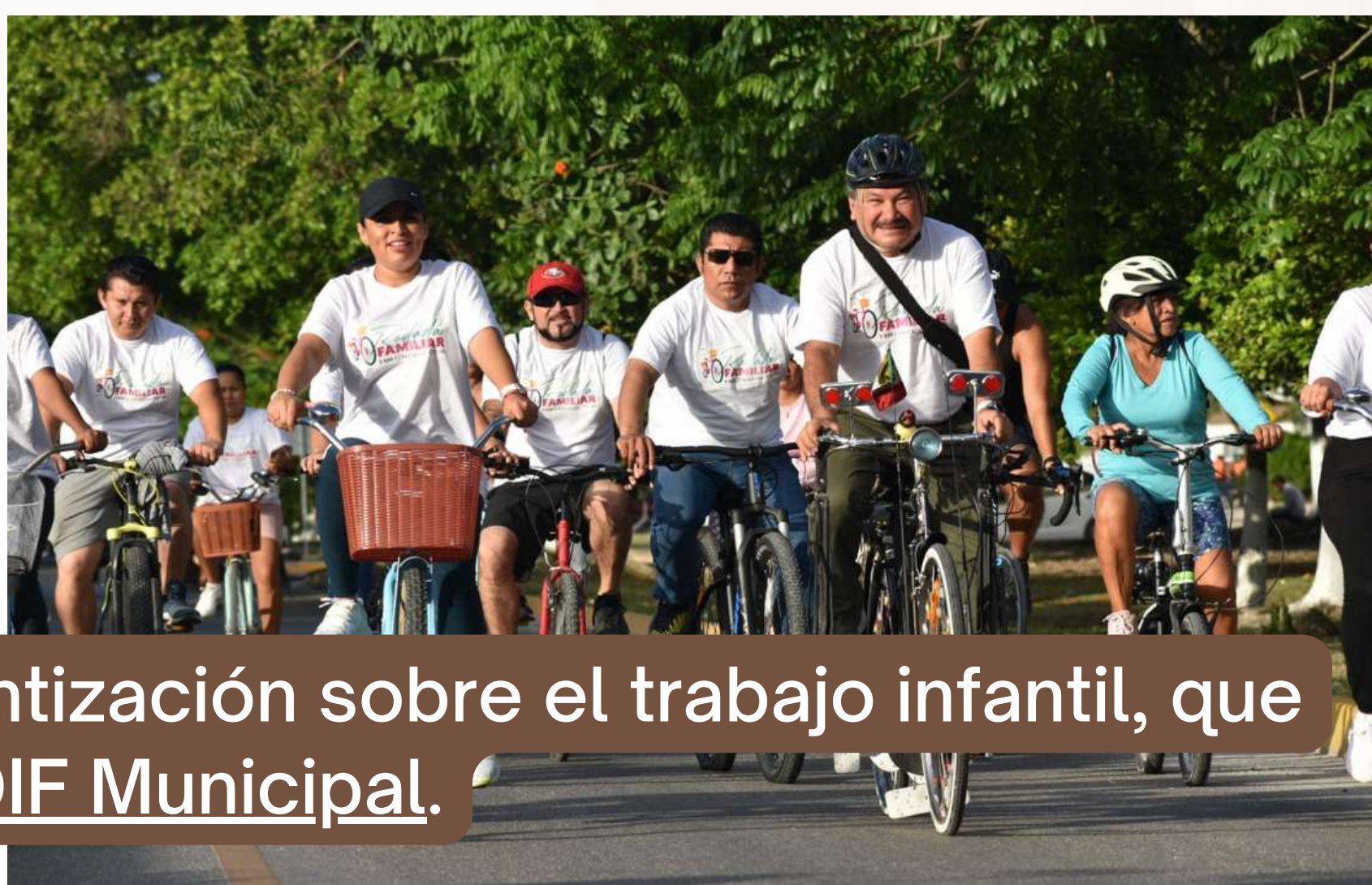
17 jun. Rodada familiar para la concientización sobre el trabajo infantil, que organizó el DIF Municipal .