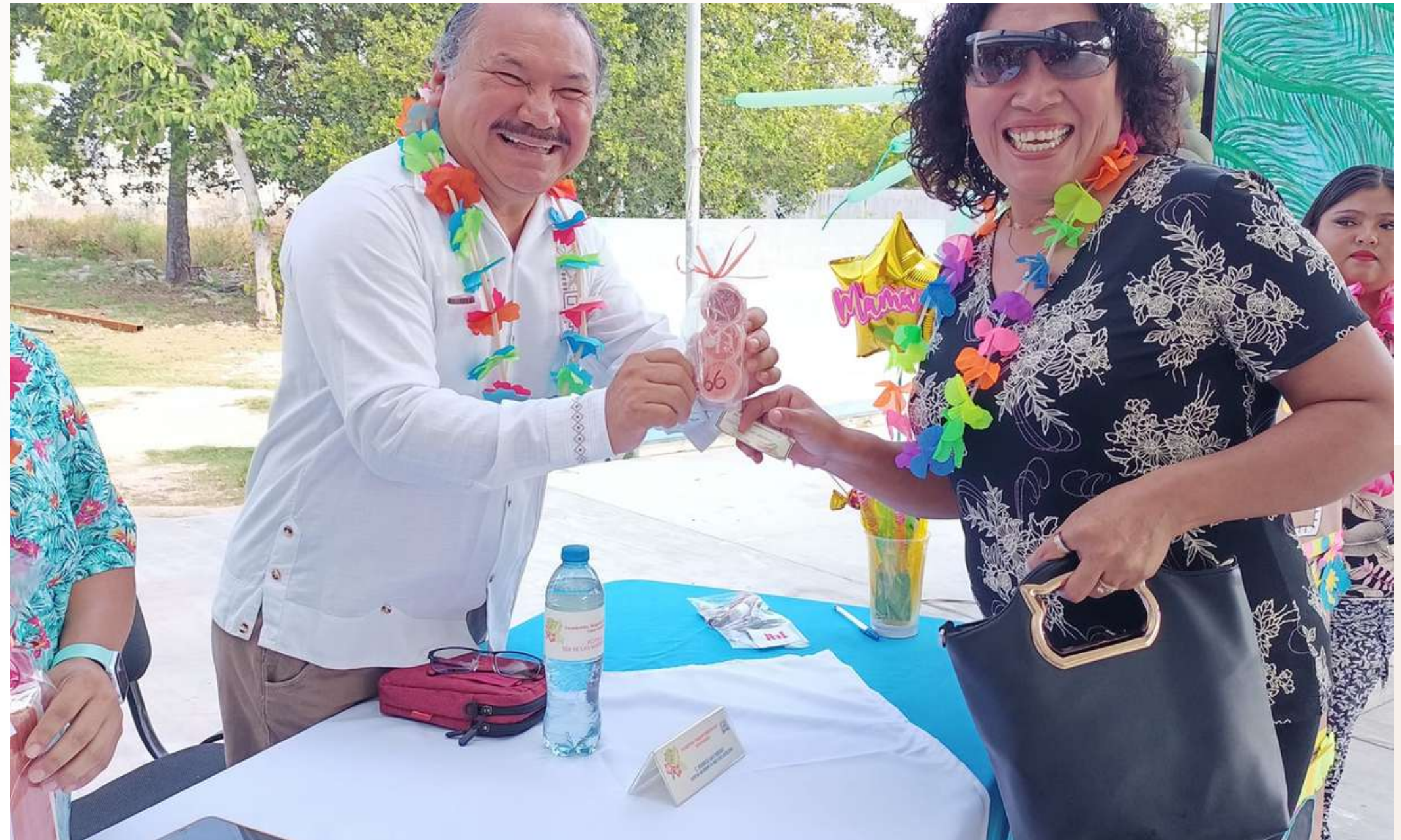
9 may. Festejo del día de las madres en la Prim. Benjamín Sabido Rosado, Puerto Morelos