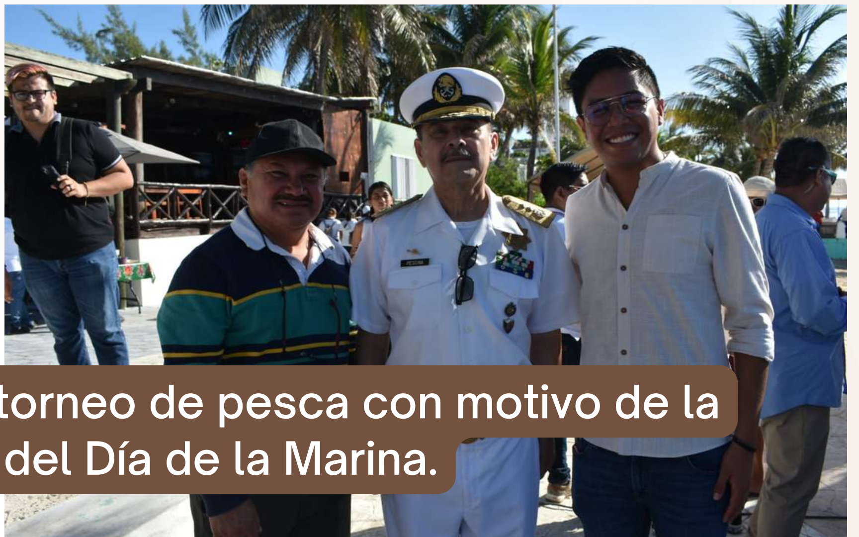
03 jun. Disparo de salida del torneo de pesca con motivo de la conmemoración del Día de la Marina.