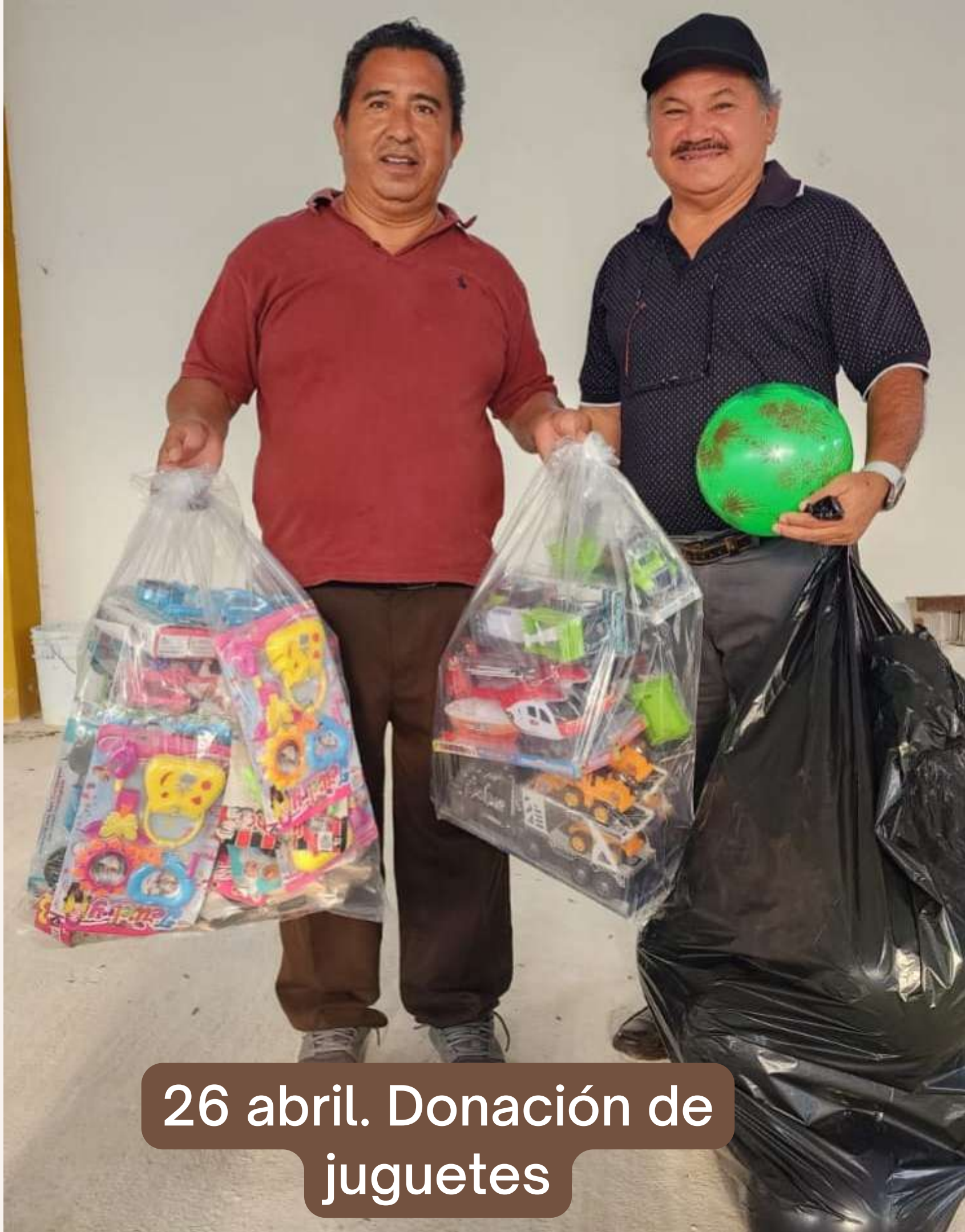
26 abril. Donación de juguetes