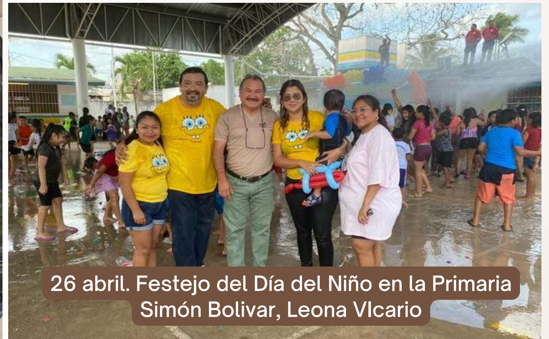
26 abril. Festejo del Día del Niño en la Primaria Simón Bolívar, Leona Vicario