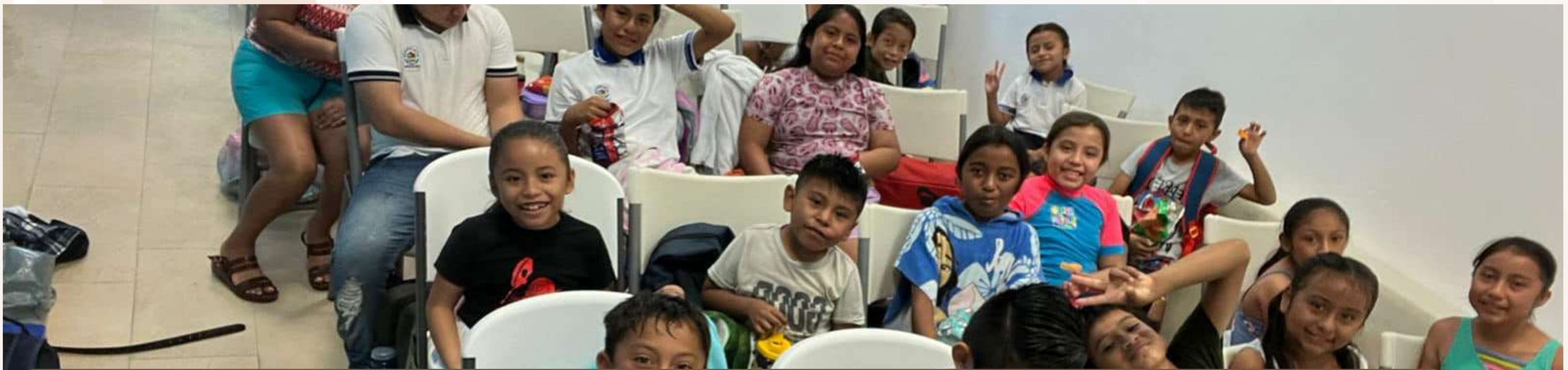
14 may. Excursión a Delfinus, niños de la plrmaría Simón Bolívar Leona Vlcario