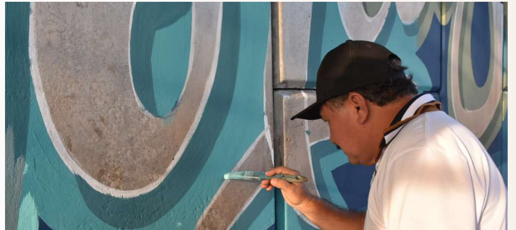
17 may. Sesión de Pintura en el Mural Bajo Puente Norte