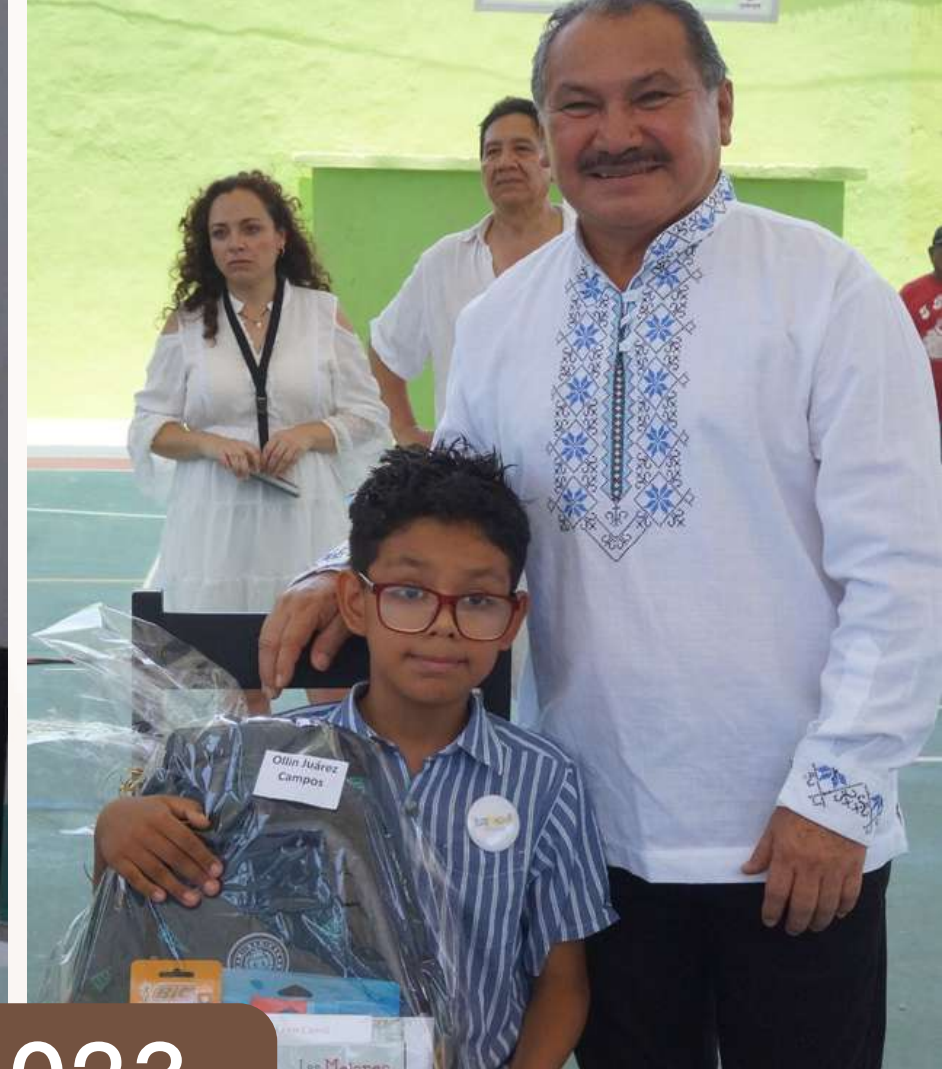
30 jun. Sesión Ordinaria de Cabildo Infantil 2023.