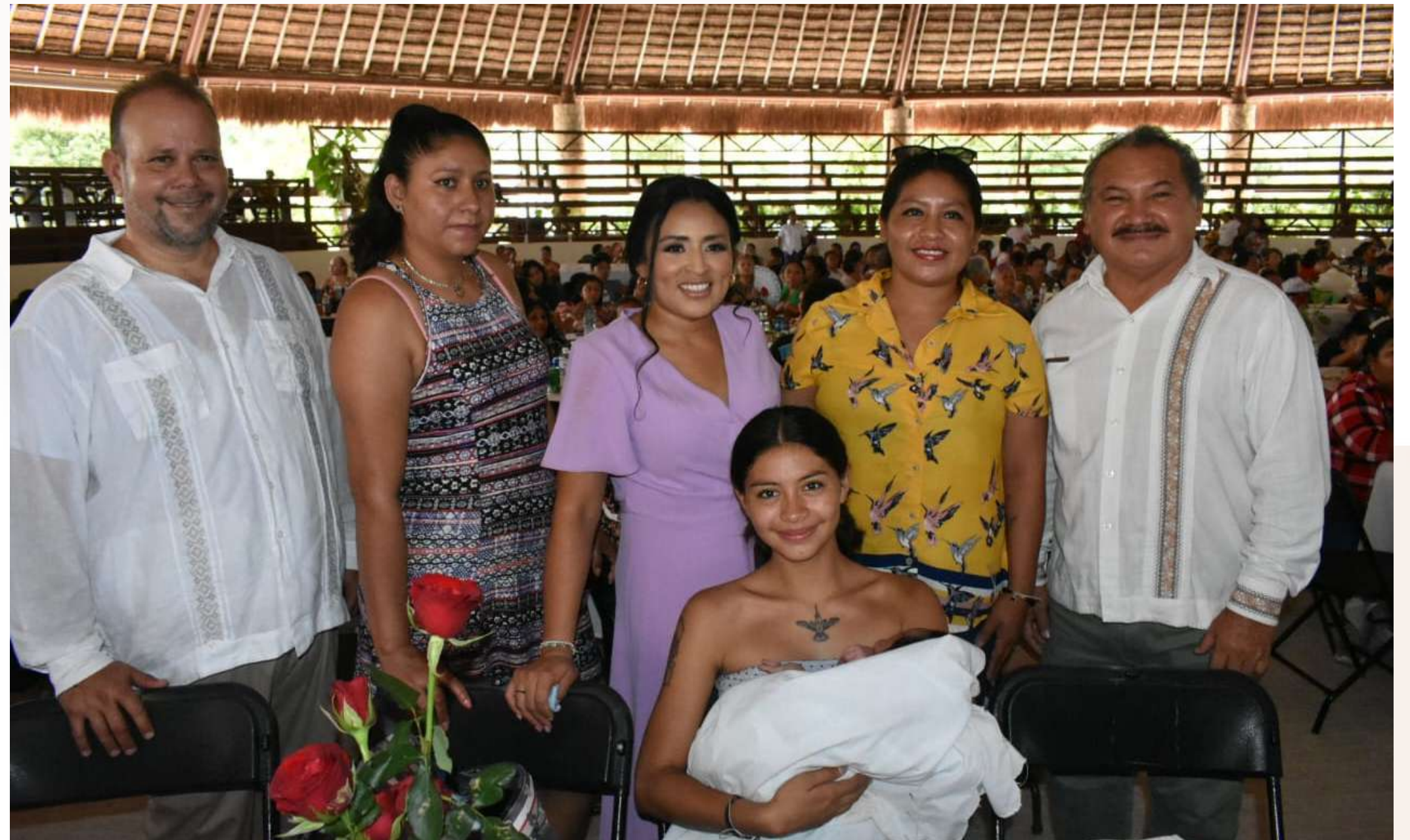
12 may. Festejo Municipio “Día de las Madres”