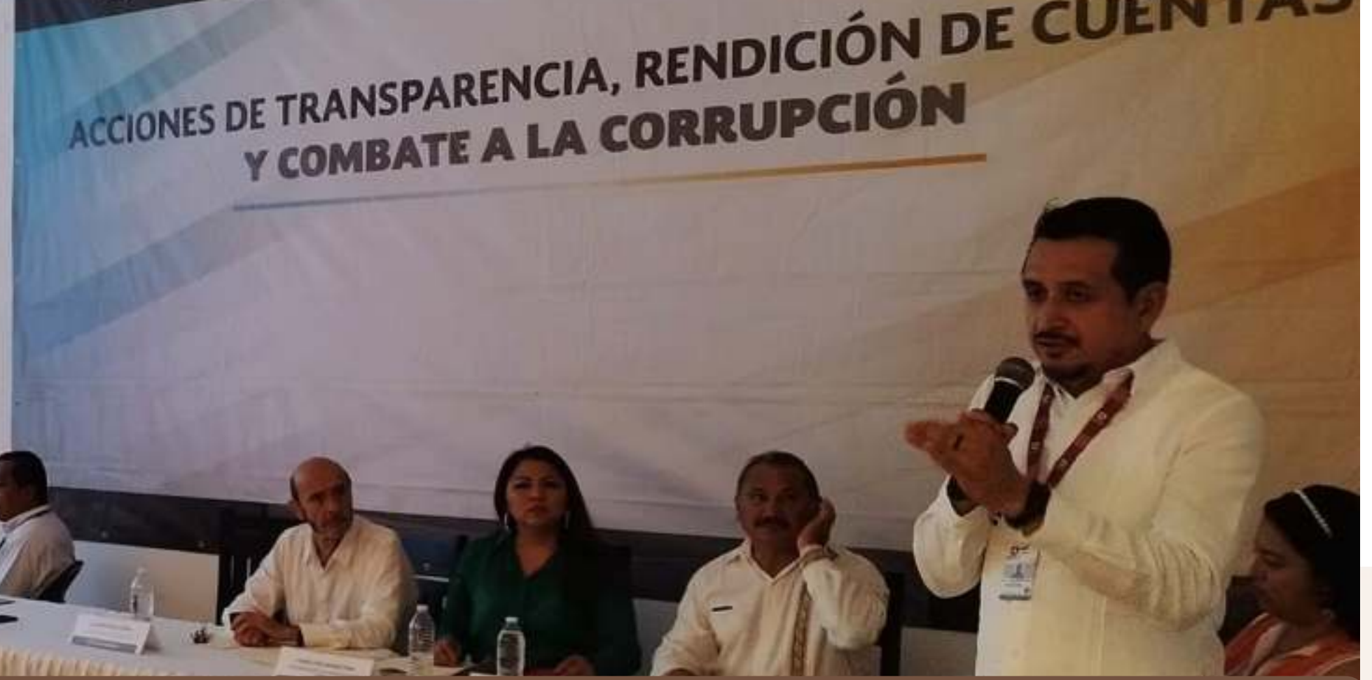
24 nov. Curso de capacitación sobre entrega/recepción para los trabajadores del Ayuntamiento.