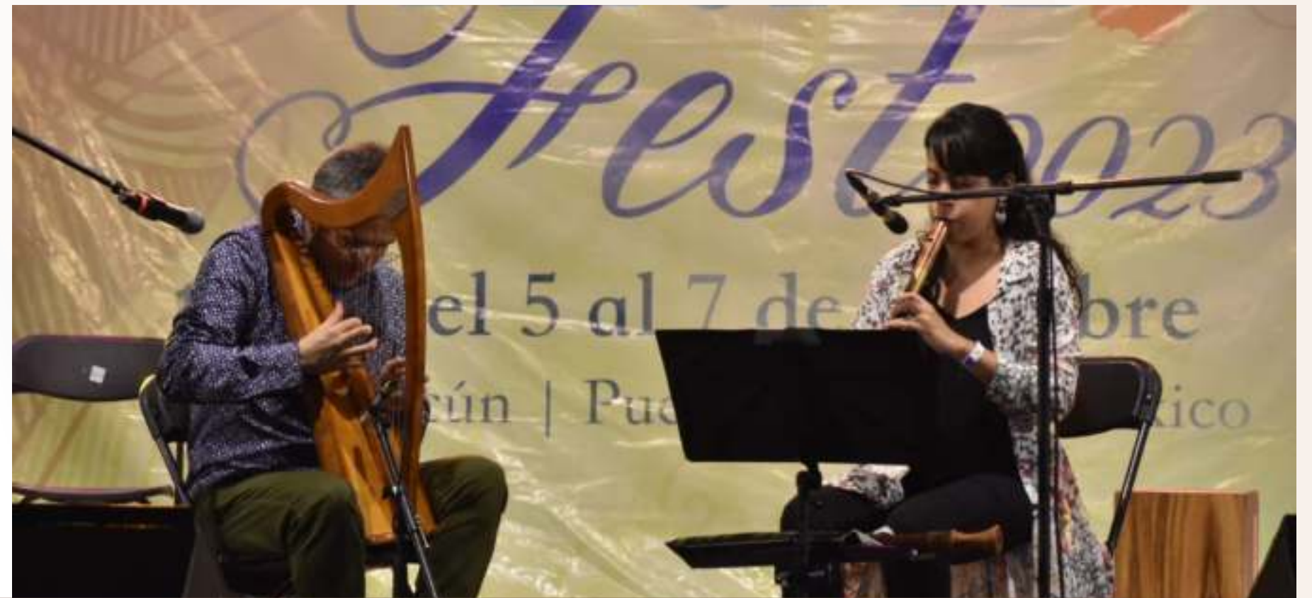
07 oct. Novena Edición del Festival Internacional ArpaFest 2023 en Puerto Morelos