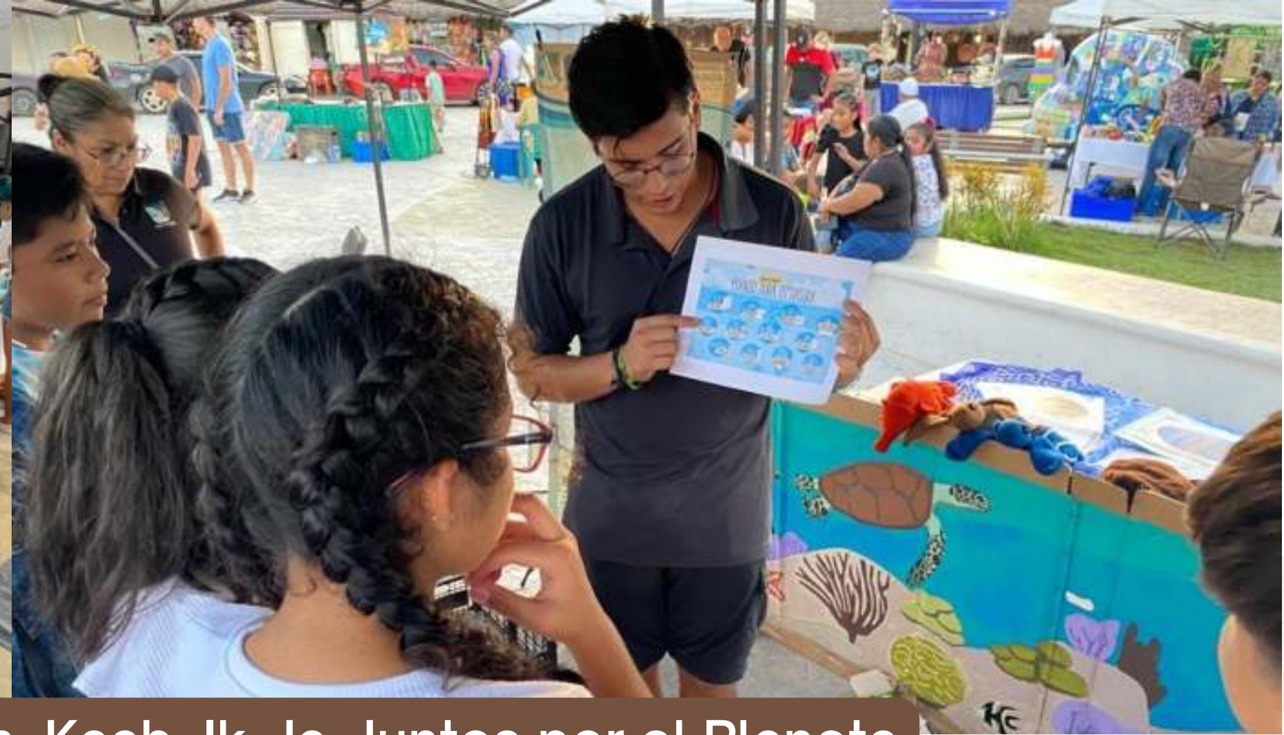
14 oct. Rally y Feria Ambiental K'iin, Kaab, Ik, Ja, Juntos por el Planeta