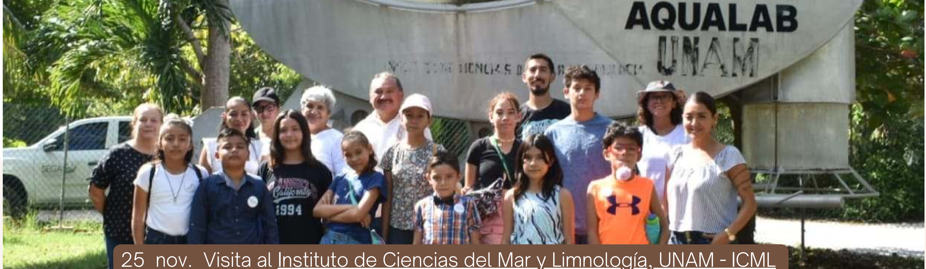
25 nov. Visita al Instituto de Ciencias del Mar y Limnología, UNAM - ICML Campus Puerto Morelos, con el Cabildo Infantil 2024.