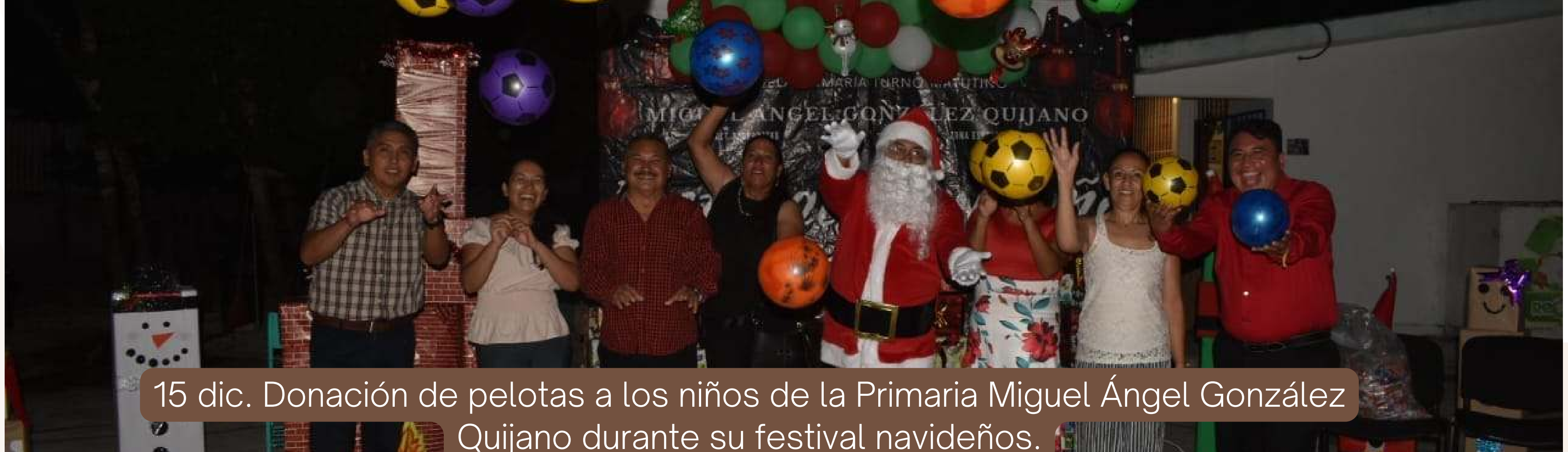
15 dic. Donación de pelotas a los niños de la Primaria Miguel Ángel González Quijano durante su festival navideños.