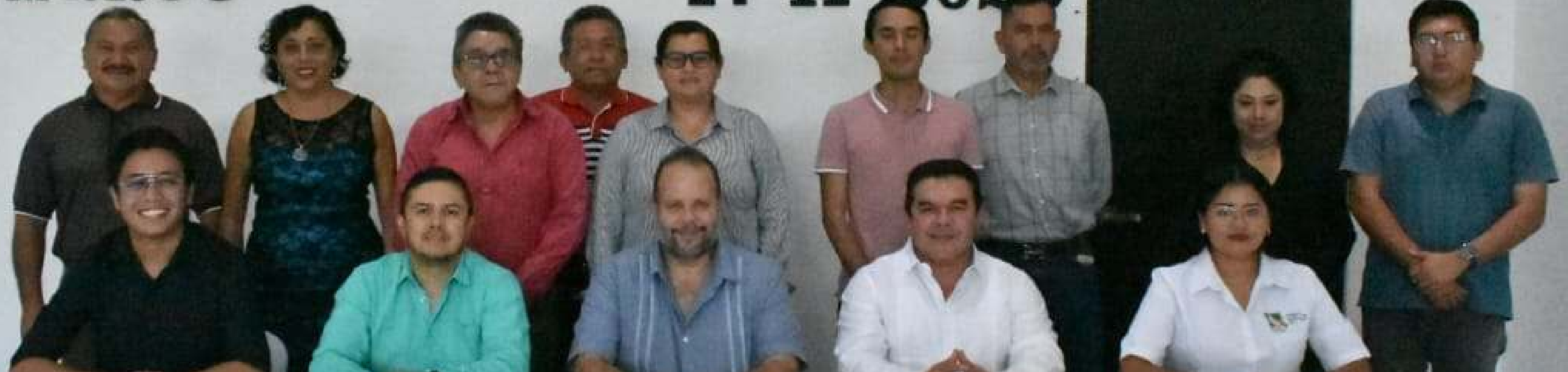
17 nov. Firma de Convenio entre el Ayuntamiento de Puerto Morelos y la Universidad Intercultural Maya de Quintana Roo.