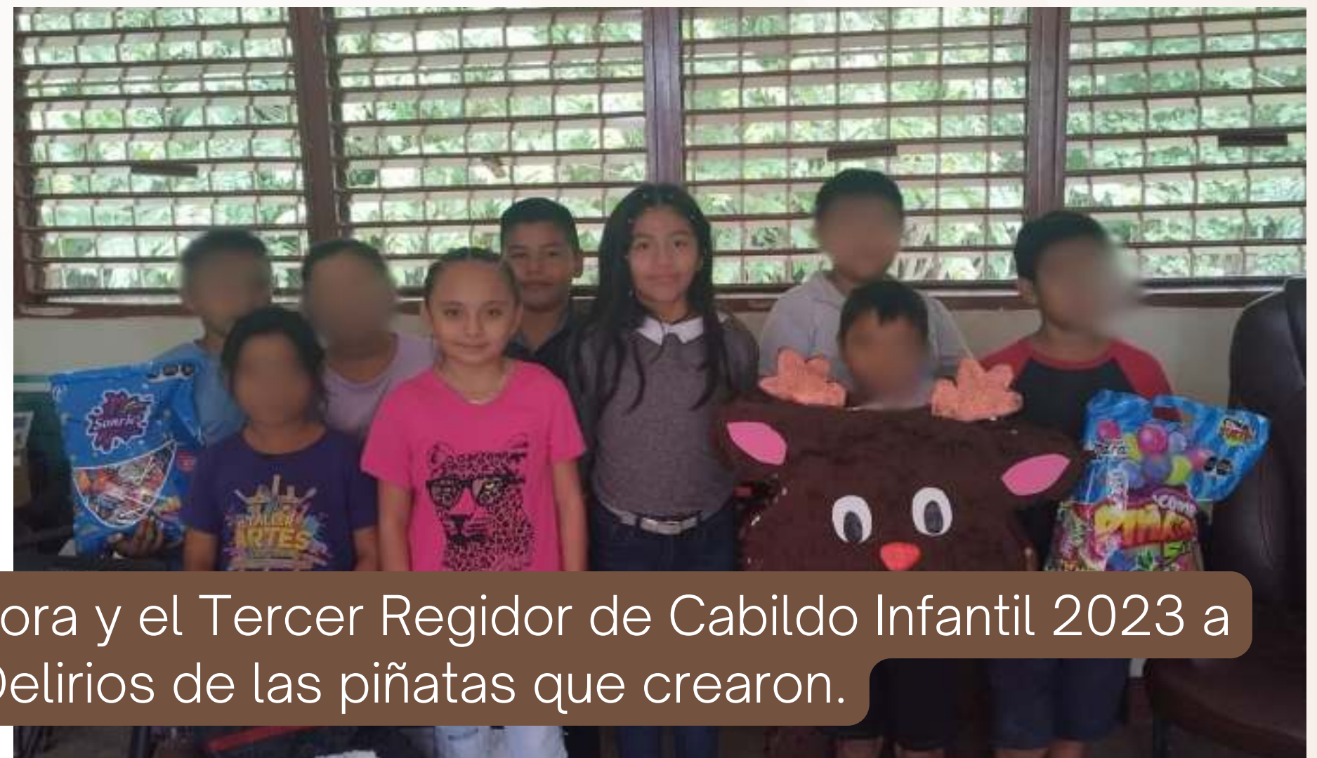
13 dic. Donación de la Síndico, la Cuarta Regidora y el Tercer Regidor de Cabildo Infantil 2023 a los niños de la comunidad de Delirios de las piñatas que crearon.