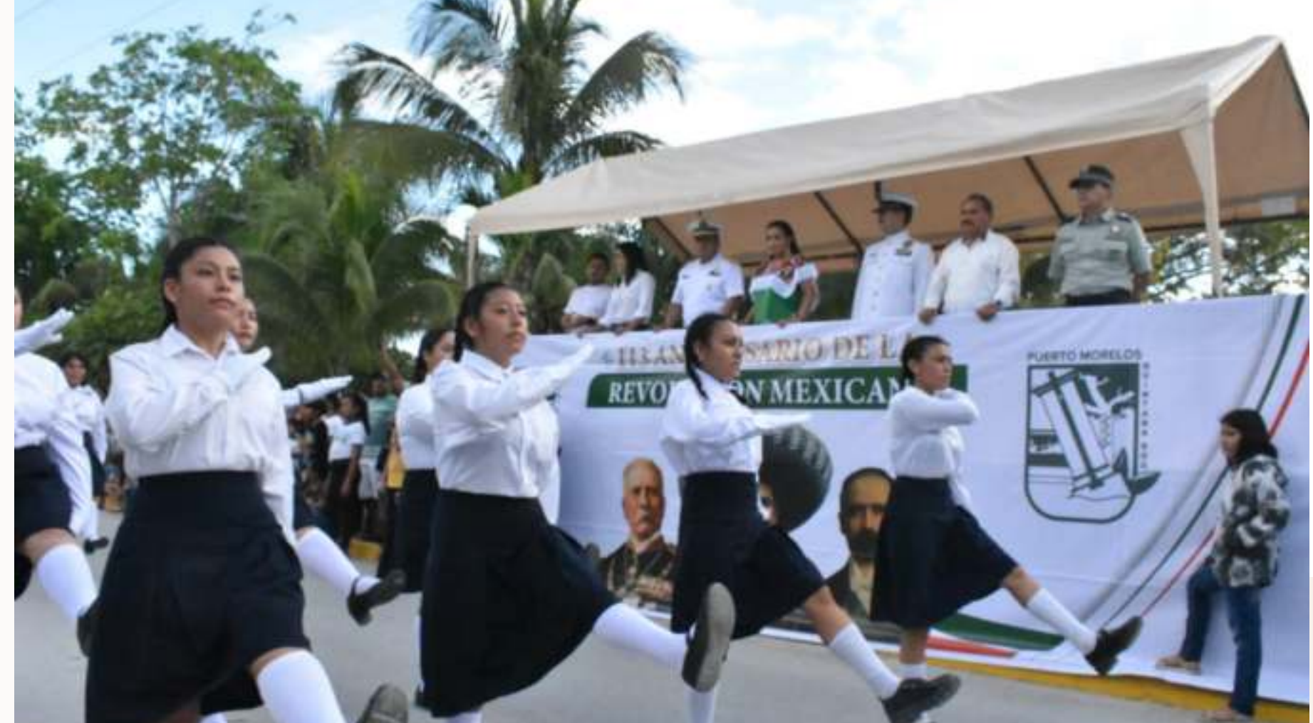
20 nov. Conmemoración del 113 Aniversario de la Revolución Mexicana