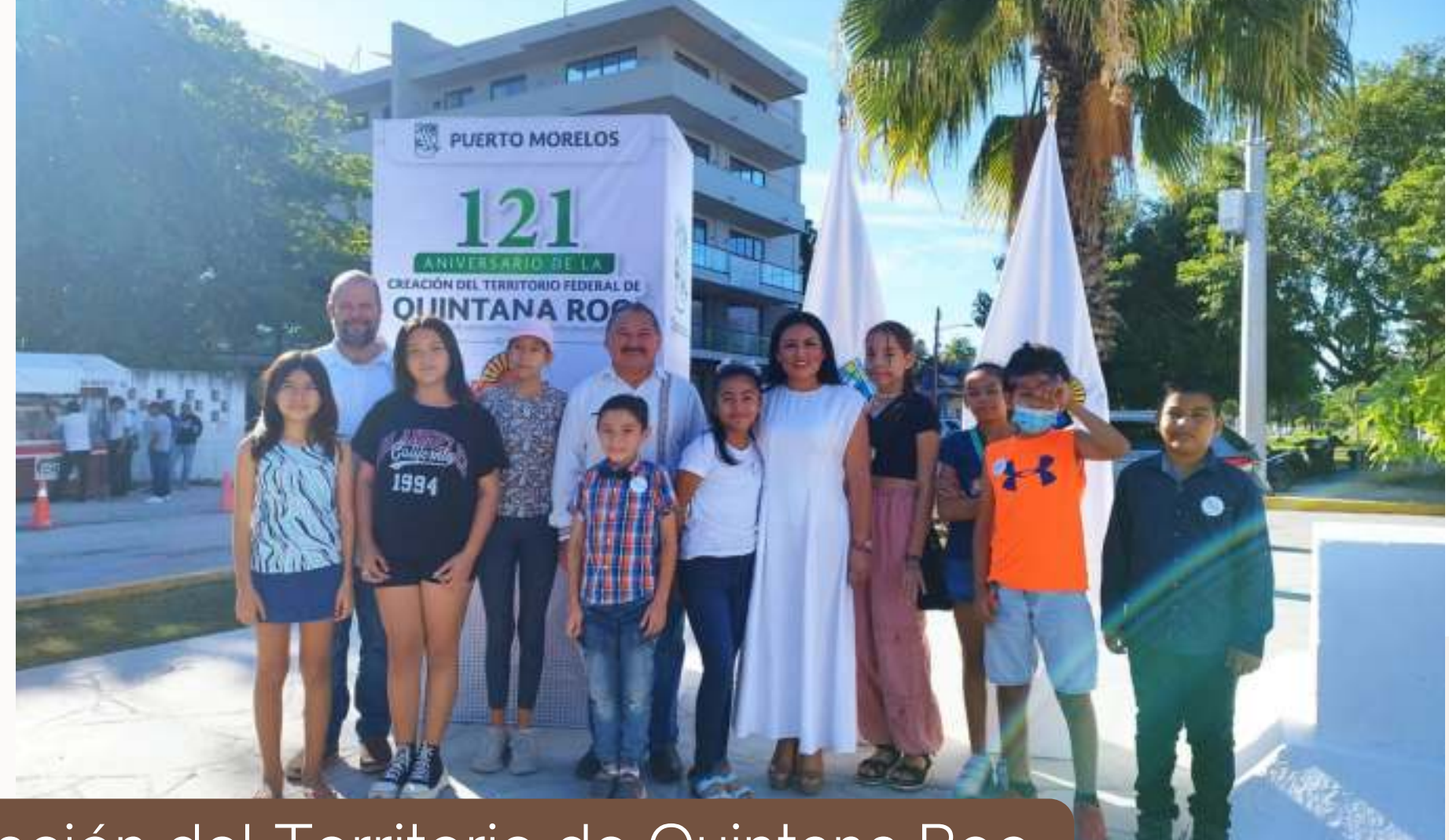
24 nov. 121 Aniversario de la creación del Territorio de Quintana Roo