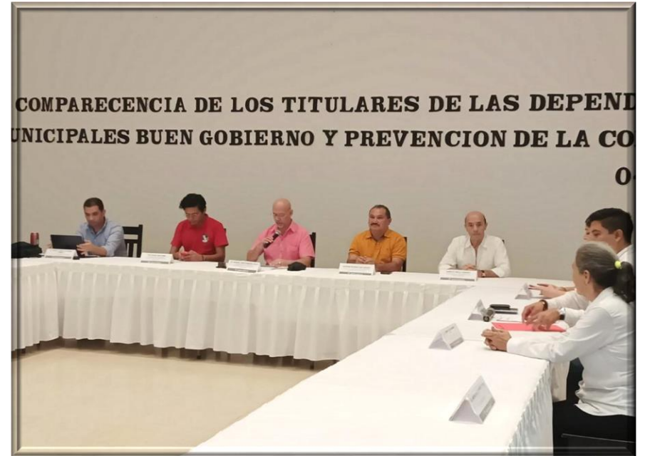
Comparecencia de los titulares de las dependencias que conforman la Administración Pública.