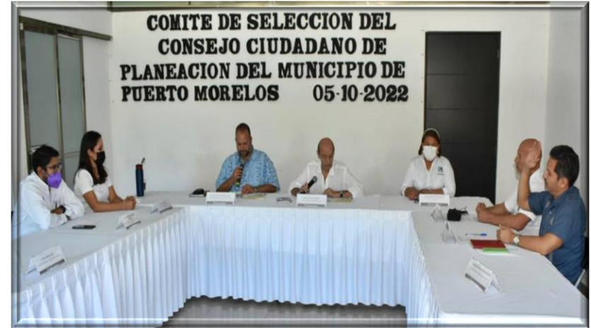
Instalación de miembros del Comité de selección para la integración del Consejo de Planeación Municipal de Puerto Morelos, 05 de octubre 2022